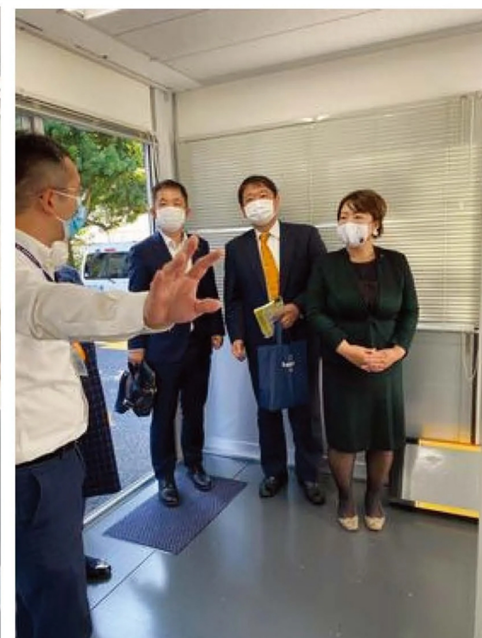
都民ファーストの会中野区議員団と中野区保健所・PCRセンター視察