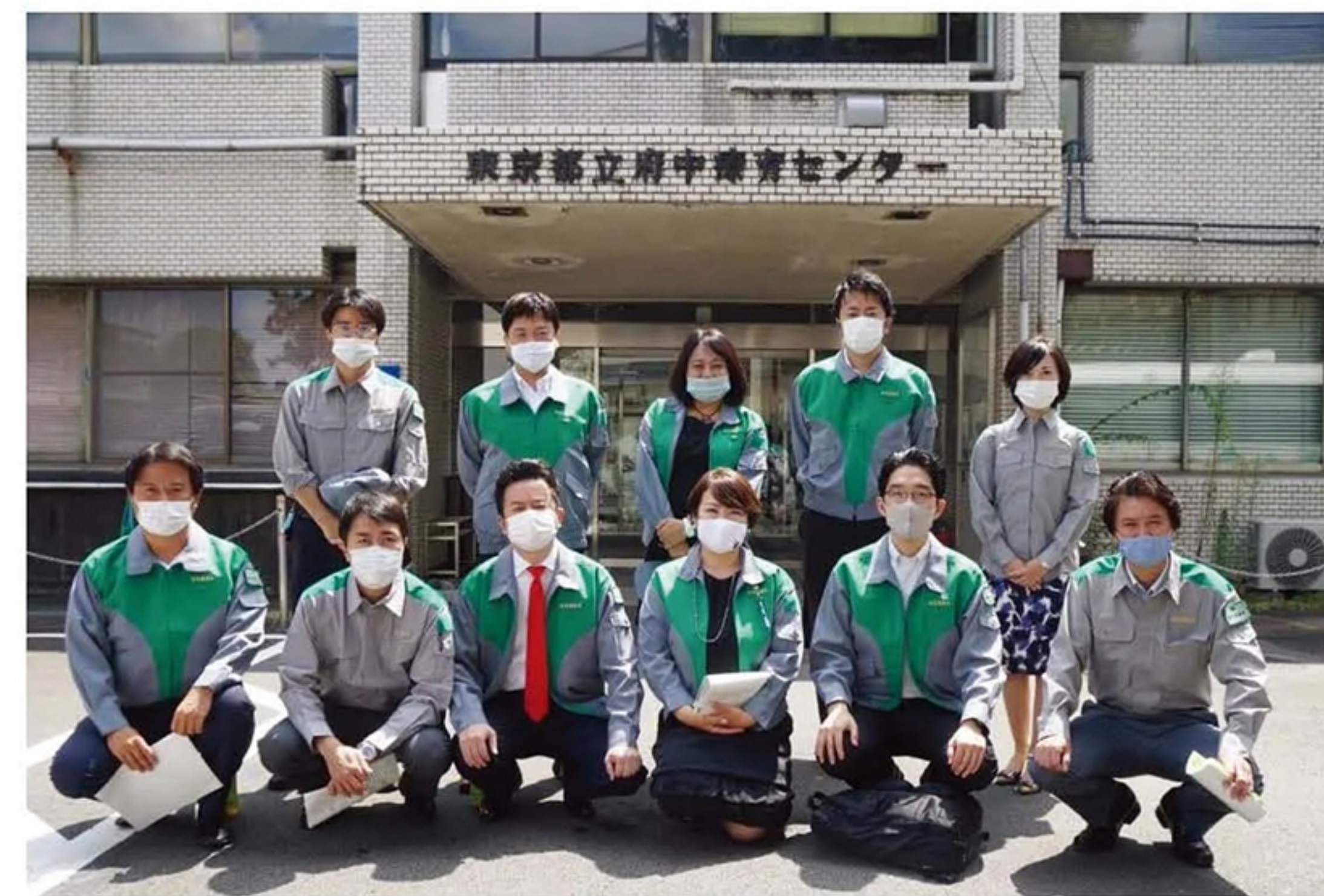
都民ファースト会東京都議団でコロナ専門病院を視察